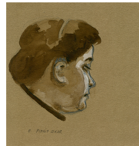
Ермаков И.Д. Портрет Нюси? 1906

© 000 Издательский дом «ERGO», 2015. Все права защищены.