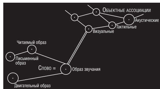
Психологическая схема словесного представления [287]

Словесное представление предстает как замкнутый комплекс представлений, объектное представление, напротив, — как открытый. Словесное представление связано с объектным представлением не всеми своими составляющими, а только образом звучания. Среди объектных ассоциаций именно визуальные замещают объект схоже с тем, как образ звучания замещает слово. Соединения образа словесного звучания с иными объектными ассоциациями, нежели визуальные, не прорисованы.